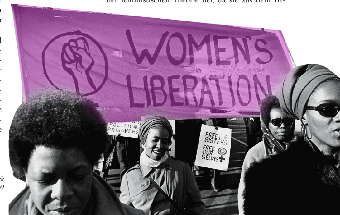
Frauenbefreiungsmärsche zur Unterstützung der Black Panther Party, New Haven, November 1969

Auch schwarze Feminismen trugen zur Entwicklung der feministischen Theorie bei, da sie aus dem Be-