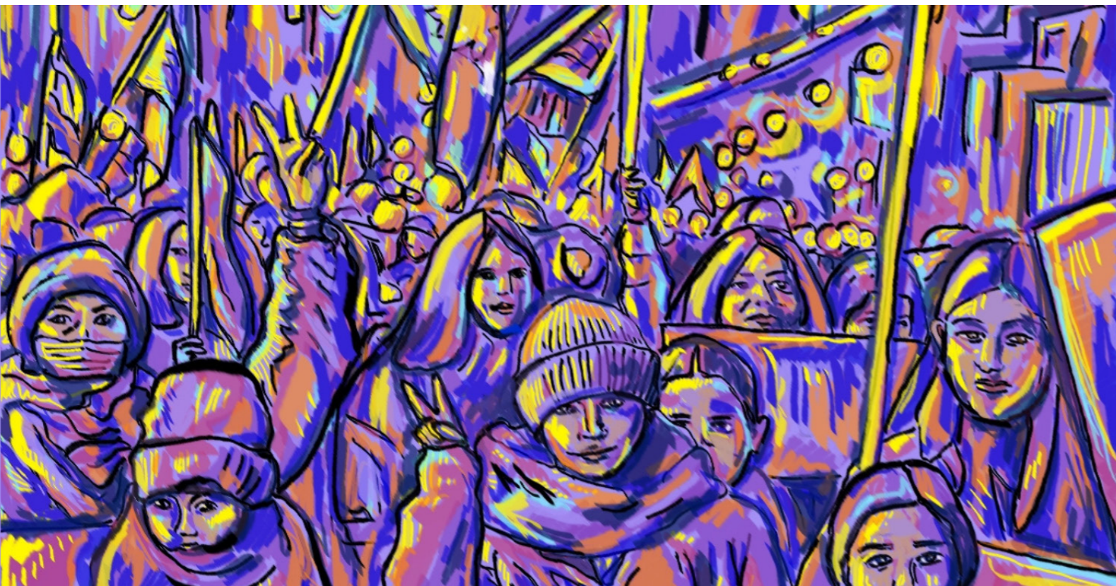
Poster für Riseup4Rojava im January 2026 von Siria

1. Das Konzept der Demokratischen Nation, so wie es von Abdullah Öcalan vorgeschlagen wurde, ist die Vision einer Gesellschaft, in der kulturelle Diversität und demokratische Prinzipien durch dezentralisierte Führung und kollektive Selbstbestimmung gelebt werden. Es ruft zu einer Transformation des Nationalstaats zu einem System auf, das auf demokratischem Konföderalismus, Frauenbefreiung und sozialer Ökologie beruht.