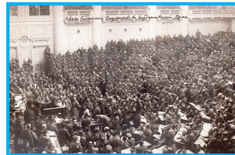
Versammlung im Petrograder Sowjet, 1917

Deshalb sage ich: Der Nationalstaat-Sozialismus führt in den Misserfolg, der demokratische Gesellschaftsso-