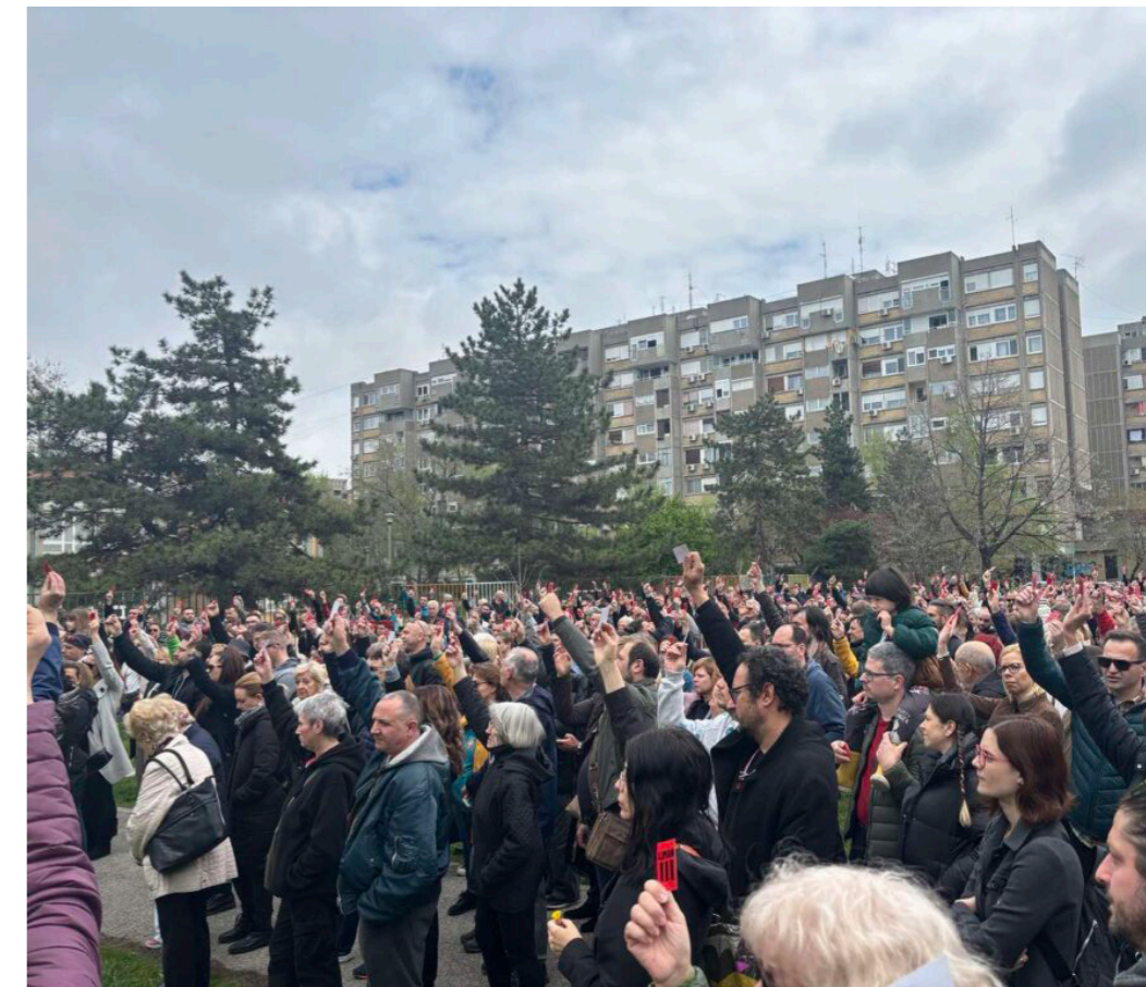
„Zborovi“-Versammlung in Novi Sad, Serbien März 2025

gen auch ihre Angst angesichts des Widerstands der Völker. Der internationale Aufstand der „Gen Z“ hat einen neuen Kontext geschaffen: Zum ersten Mal seit 1968 sind sich kämpfende Jugendliche auf der ganzen Welt wieder bewusst, dass sie derselben Dynamik des Widerstands angehören; sie bekennen sich offen zu dieser Verbindung und machen sie zu einer Stärke. Wir dürfen diese Gelegenheit nicht verstreichen lassen. Die Idee eines weltweiten demokratischen Konföderalismus der Jugend kann dieses kollektive Jugendbewusstsein in eine organisierte Kraft verwandeln. Durch die Verbindung von basisdemokratischem Aufbau, dem Zusammenschluss aller bestehenden Initiativen zu einem alternativen System und dem Internationalismus unter der Jugend aller Kontinente können wir zu einer Kraft werden, die in der Lage ist, einzugreifen und dem andauernden Weltkrieg ein Ende zu setzen!