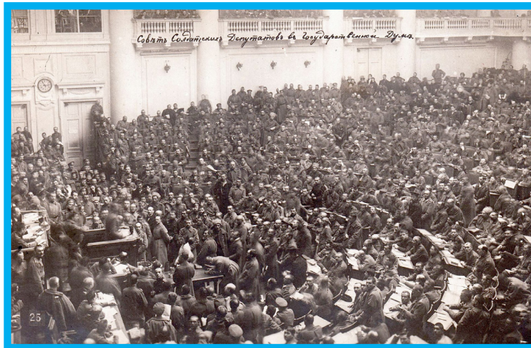
Assemblea del Soviet de Petrograd, 1917

Necessitem examinar la història dels oprimits a través de la perspectiva de la comuna, que va sorgir, abans de res, com una formació d'autodefensa. Això requereix veure les comunitats tribals primerenques, com els inicis de la comuna, i adoptar una perspectiva històrica fins al proletariat d'avui en dia— i tots els grups oprimits.