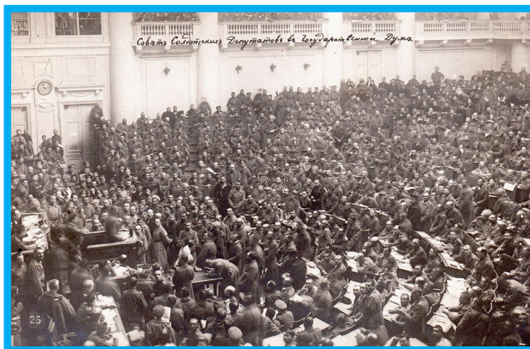
Sidang Soviet Petrograd, 1917

Atas dasar ini, kami menyatakan bahwa sejarah tidak dapat direduksi semata-mata menjadi perjuangan kelas. Meskipun perjuangan kelas memang merupakan bagian di dalamnya, lebih akurat untuk membaca sejarah sebagai sebuah proses panjang relasi dan konflik antara perkembangan komunal dan perkembangan anti-komunal yang membentang kembali hingga