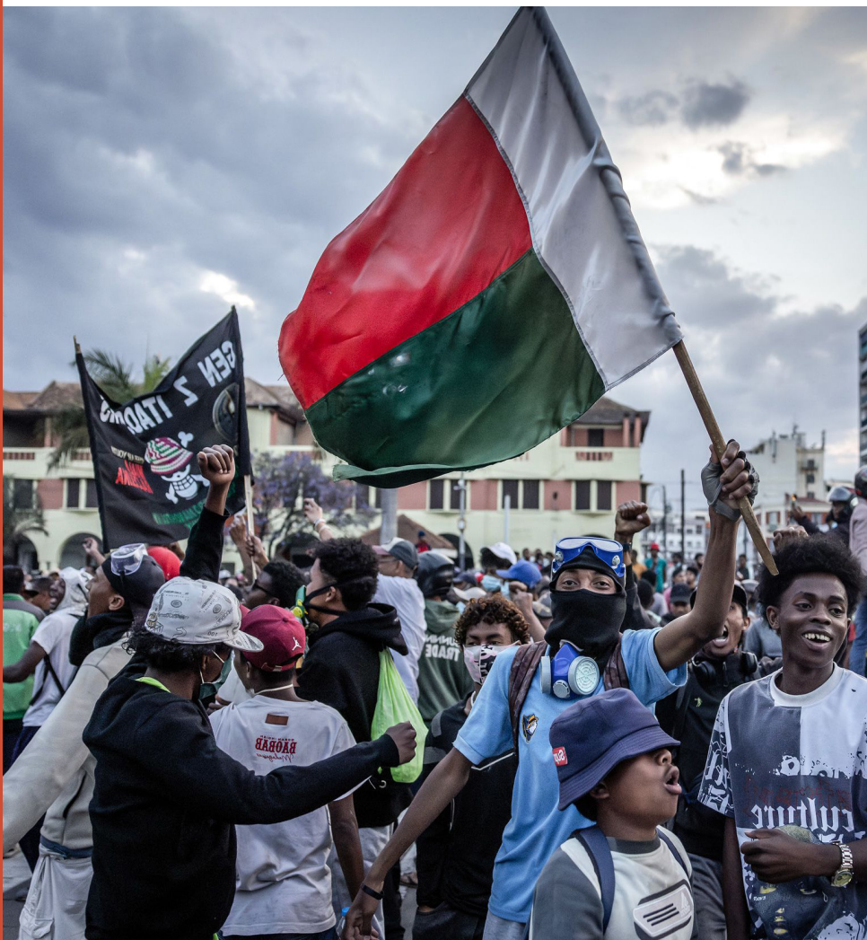
Demonstrasi pemuda di Antananarivo, Madagaskar, 11 Oktober 2025

Pada akhir Februari 2026, sebagai kelanjutan dari pemberontakan bulan-bulan sebelumnya, pemuda Indonesia menyelenggarakan Festival Saba Kampung, dengan slogan “Merevitalisasi Komune di Tengah Modernitas yang Dipaksakan.” Tujuan pertama mereka: “Merehabilitasi Ruang Hidup sebagai Ekosistem Sosial-Budaya Holistik. Mengembalikan fungsi desa sebagai