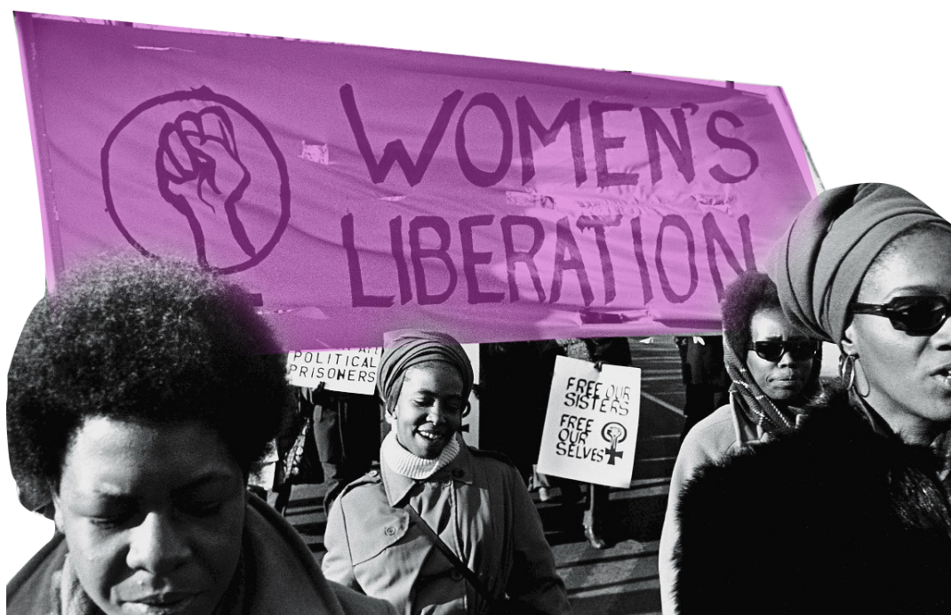
Manifestation d'un groupe de libération des femmes en soutien au Black Panther Party, New Haven, novembre 1969

En ce sens, les mouvements de femmes sortent victorieux de l'héritage de 1968, contrairement à la plupart des courants de gauche extraparlimentaires. Ils promeuvent une culture politique d'unité dans la diversité et développent