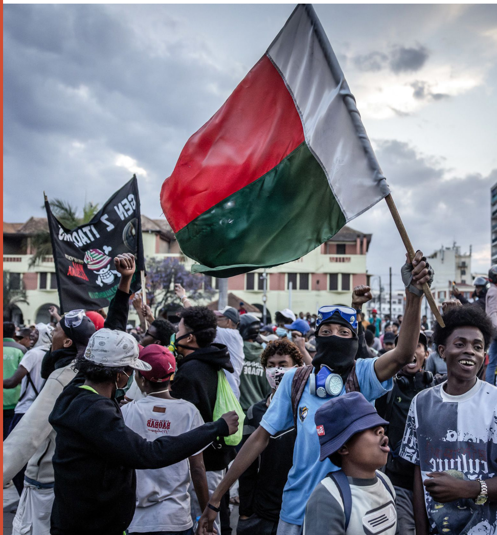
Soulèvement de la jeunesse à Antananarivo, Madagascar, 11 Octobre 2025

Dans la mesure du possible, nous pouvons commencer dès aujourd'hui à construire notre nouveau mode de vie à partir de la base, grâce à un processus de communalisation, c'est-à-dire de construction de la commune. Les soulèvements peuvent faire avancer l'histoire, mais ils ne peuvent aboutir sans un travail de construction lent et continu mené en parallèle. Nous devons cesser de nous adresser uniquement