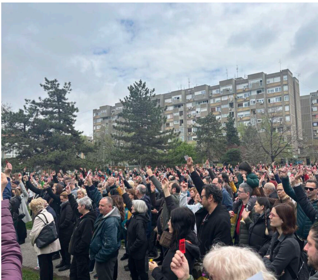
Assemblée « Zborovi » dans la ville de Novi Sad, Serbie,